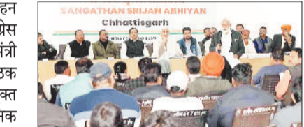
तत्काल बीएलए नियुक्त करने का भी निर्देश दिया है।

अंबिकापुर। मतदाता सूचियों के विशेष गहन पुनरिक्षण को लेकर बुधवार को जिला कांग्रेस कमेटी कार्यालय राजीव भवन में पूर्व उपमुख्यमंत्री टीओएस सिंहदेव की अध्यक्षता में समीक्षा बैठक ली गई। बैठक में एमआईआर को लेकर नियुक्त प्रभागियों के साथ ही कांग्रेस के सभी सांठगतिक ब्लॉक अध्यक्ष एवं मंडल अध्यक्ष मौजूद थे। इस दौरान पूर्व डिप्टी सीएम श्री सिंहदेव ने कहा कि एक दल विशेष के द्वारा हाल ही में पार्टी कार्यकर्ताओं को सभी बृथ पर कांग्रेस के 50 वोट कटवाने के साथ ही अपने 50 अतिरिक्त वोट समायोजित करने के निर्देश दिए हैं। संभवतः इस कार्य में लगे अधिकारियों को भी इस बाबत अनौपचारिक निर्देश प्राप्त हुए हैं। इसके प्रति सतर्कता बरतनी है। उन्होंने बृथ लेवल एजेंट को यह सलाह जारी किया है कि वे अपने बृथों पर बीएलओ से तालमेल कर दैनिक आधार पर आने वाली ऐसी सूची का अवलोकन कर इस कवायद पर नजर रखें एवं ऐसी अनियमितताओं से जिला संगठन को तत्काल अवगत कराएं ताकि इसके विरुद्ध त्वरित कार्रवाई की जा सके। उन्होंने जिला संगठन के साथ ही ब्लॉक कार्यकारिणी और मंडल कार्यकारिणी के सभी सदस्यों को तत्काल उनके बृथ पर बीएलओ के साथ नियुक्त कर कार्य सम्भालने का निर्देश भी दिया है। साथ ही उन्होंने पूरे जिले में नवगठित 94 बृथ पर