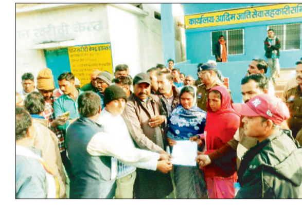
ज्ञापन सौंपते किसान।