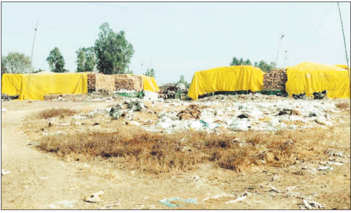
देवनगर में संग्रहण केंद्र में जमा धान।

धान उठाव की धीमी गति से सहकारी समितियों की समस्याएं बढ़ती जा रही है। उपार्जन केंद्रों में धान रखने की जगह नहीं होने के कारण आधा दर्जन से अधिक समितियों द्वारा दूसरी जगह धान खरीदी की जा रही है जबकि अन्य कई समितियां धान खरीदी के लिए नई जगह तलाश कर रही है।