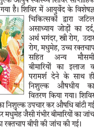
चिकित्सकों द्वारा जटिल असाध्यवा जोड़ों का दर्द, अर्थ भंगदूर, खी रोग, उदर अण, मधुमेह, उच्च रक्तचाप सहित अन्य मौसमी बीमारियों का इलाज व परामर्श देने के साथ ही निशुल्क औषधीय का वितरण किया गया।

लहपट्टरा। विकासखंड स्तरीय निशुल्क आयुष स्वास्थ्य शिविर साप्ताहिक बाजार परिसर में आयोजित किया गया है। शिविर में आयुर्वेद के विशेषज्ञ चिकित्सकों द्वारा जटिल असाध्यवा जोड़ों का दर्द, अर्थ भंगदूर, खी रोग, उदर अण, मधुमेह, उच्च रक्तचाप सहित अन्य मौसमी बीमारियों का इलाज व परामर्श देने के साथ ही निशुल्क औषधीय का वितरण किया गया। शिविर में आयुष विभाग द्वारा 359 रोगियों का निशुल्क उपचार कर औषधि बांटी गई तथा 88 रोगियों का रक्त प्रशिक्षण कर मधुमेह जैसी गंभीर बीमारियों का जांच किया गया। साथ ही 179 रोगियों का रक्तचाप बीपी की जांच की गई।